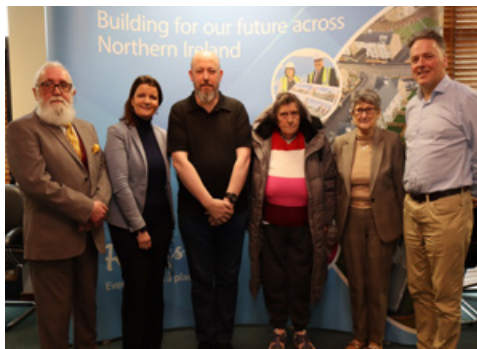
圖片：我們的新租戶執行委員會：

作為租戶代表，他們參與獨立小組、一般小組和其他相關小組，並代表 Radius Housing 的租戶。